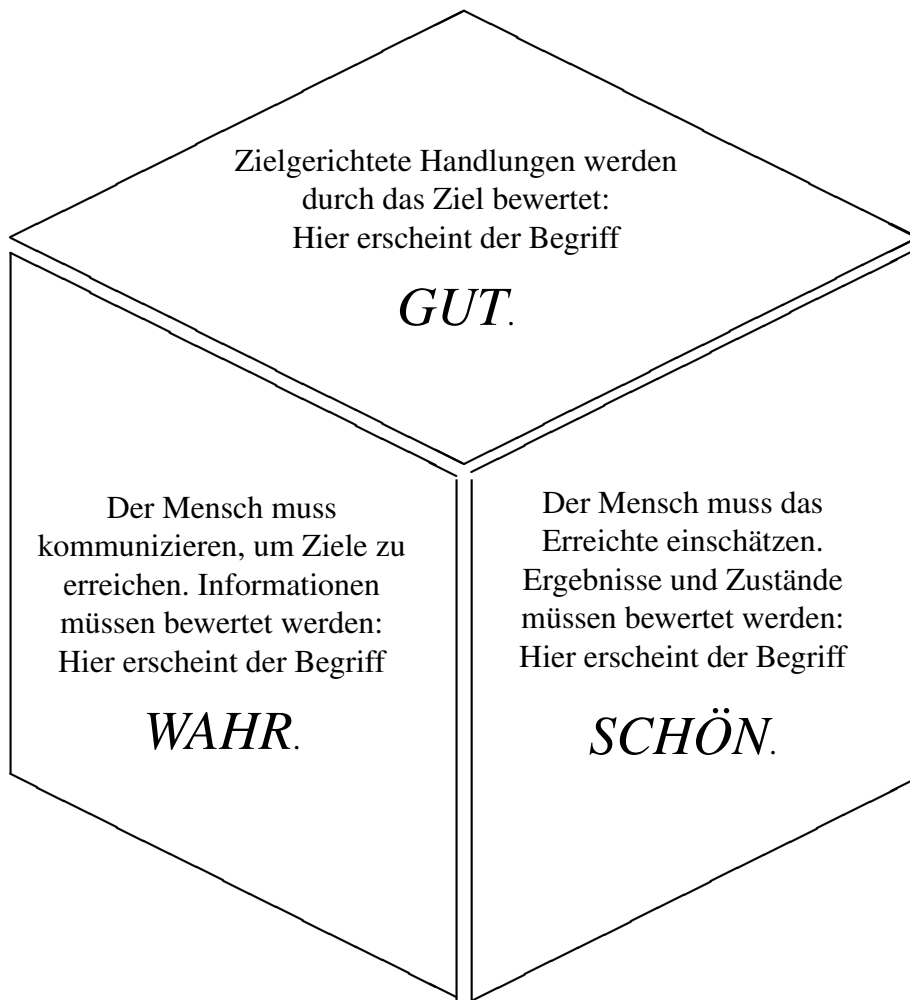
Abbildung 1: Drei unterschiedene Bewertungen